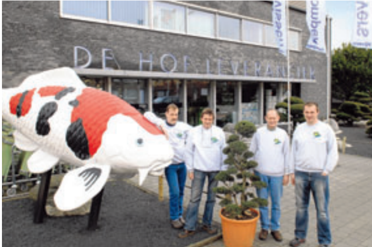
De Hof-Leverancier, dé vijverspecialist van de hele Benelux.

"Alles wat met vijvers te maken heeft, vind je hier. Dat gaat van kleine siervijvers tot enorme zwemvijvers. Die laatste zijn trouwens een echte hype. Je hebt dan uiteraard geen last van chloor en een mechanische en biologische filter zorgen ervoor dat het zwemgedeelte altijd proper is. Nog populair zijn koivijvers. Koi zijn menslievende vissen, die graag spelen en voedsel uit je