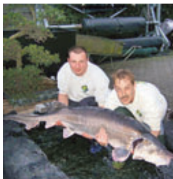
Prijs : 3600 euro.

De vijf medewerkers staan je steeds met raad en daad bij. "Wij doen zelfs gratis wateranalyses voor klanten", besluit de zaakvoerder.